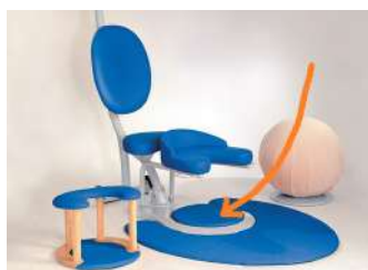
Ref. PTM Alfombra cobertora hueco soporte accesorios