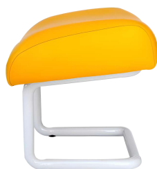
Ref. EHOC Taburete para personal médico