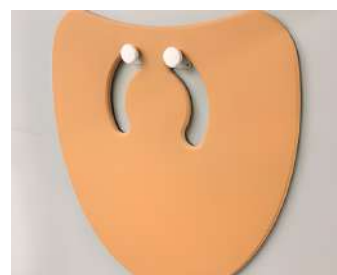
Ref. DGHFMS-HALT Colgador Ref.DGHFMS