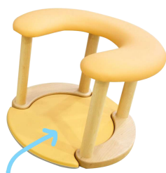
Ref. DGHM Alfombra interior de taburete Dullstein