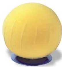
PELVIBALL Pelota de dilatación Ref. PBall-65 / PBall-55