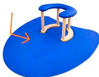
Ref. DGHFMS Alfombra exterior de taburete Dullstein con esquinas redondeadas