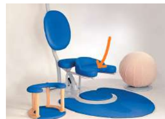
Ref. SGHG Taburete de parto encastrable