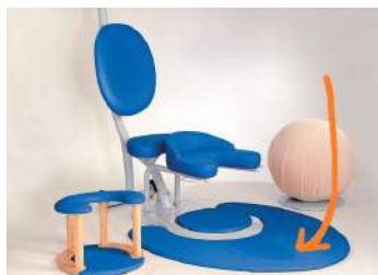
Ref. PTFMS Alfombra exterior para sistema de parto