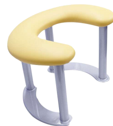
DULLSTEIN Taburete de parto y dilatación Ref. DGH / DGH alu