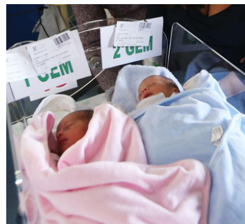
Mabim Twins (50.I20MBT)