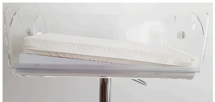
Posicionador trendelenburg/antitrendelenburg opcional (50.220MT)