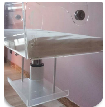
Colchón opcional (50.I20MT) Bandeja almacen. opcional (50.I20AP)