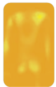
Con Bi-Pad DuoFit Reducción y distribución de presión homogénea